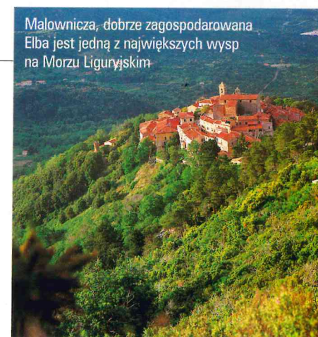
Malownicza, dobrze zagospodarowana Elba jest jedną z największych wysp na Morzu Liguryjskim.

Proponujemy także krótki wypad na jedną z wysepek na Morzu Liguryjskim, tworzących Parco Nazionale dell' Arcipelago Toscano. Z Piombino do Portoferraio płyniemy lokalnym promem niespełna godzinę, tyle samo do Porto Azzurro. Wodoloty nieco krótszą odległość do Cavo pokonują w 15 minut. Opłata za dwie osoby plus samochód wynosi 60-80 tys. lirów.