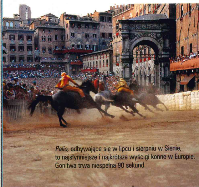
Palio, odbywające się w lipcu i sierpniu w Sienie, to najsłynniejsze i najkrótsze wyścigi konne w Europie. Gonitwa trwa niespełna 90 sekund.

Z Sieny jedziemy okrężną Via Cassia (SS2) w kierunku Viterbo. Na 45. kilometrze zjeżdżamy w boczną drogę SS146, która prowadzi przez Cortonę do Arezzo. W mijanej po drodze Pienze zatrzymujemy się w tawernie „Latte di Luna”. Dwudaniowy posiłek kosztuje ok. 30 tys. lirów. Na nocleg wracamy do Florencji lub zatrzymujemy się w malutkim, lecz bardzo przyjemnym sienneńskim hoteliku „Garibaldi” przy via Giovanni Dupre 18, dwa kroki od słynnego Piazza del Campo, płacąc za pokój dwuosobowy 120 tys. lirów.