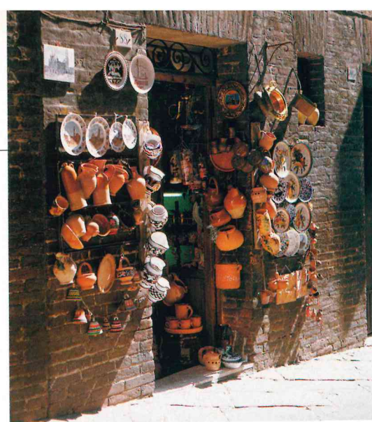
MAPA W. ŚWIECICKI

■ Cena benzyny: litr bezołowiowej 98 kosztuje 2200 lirów, czyli ok. 4,50 zł (1000 ITL = 2,05 zł).