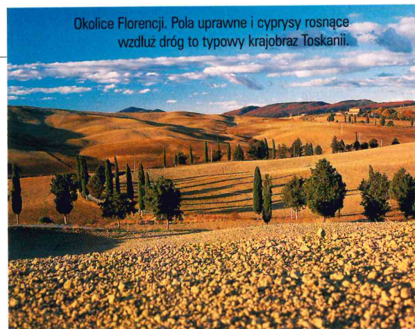
Okolice Florencji. Pola uprawne i cyprysy rosnące wzdłuż dróg to typowy krajobraz Toskanii.

Można wypożyczyć rower (5 godz. – 12 tys. lirów, 1 dzień – 20 tys. lirów; rowery górskie – odpowiednio 20 tys. lirów i 30 tys. lirów) albo popularny we Włoszech skuter (cały dzień – 60 tys. lirów) i udać się na Piazzale Michelangelo na lewym brzegu Arno, skąd rozpościera się panorama miasta z Apeninami w tle. W okolicy radzimy koniecznie zobaczyć pobliskie Fiesole (10 km na północny wschód od centrum), osadę z czasów starożytnych z pozostałościami budowli rzymskich.