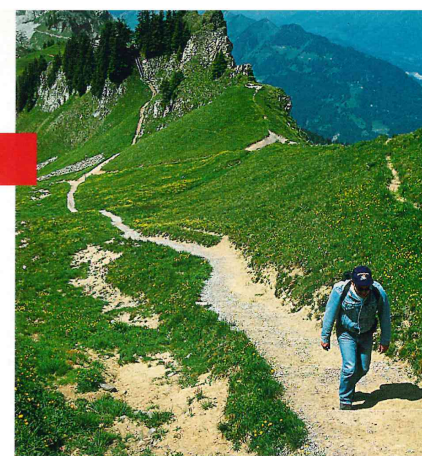
Górska ścieżka w kantonie Berno. Panorama Alp Berneńskich.

Stolica kraju, jak wolą Szwajcarzy „miasto federalne”, należy do najładniejszych w Europie. Starówka wpisana została w 1983 roku na listę światowego dziedzictwa UNESCO. Z Berna jedziemy autostradą A12 (E27), prowadzącą na południowy zachód – przed Vevey łączy się z A9 (E62). Równolegle, przy Jeziorze Genewskim, obwarowanym od południa łańcuchem Alp, biegnie boczna droga, którą poprzez Lozannę docieramy do Genewy. Miasto ze wspinałą 150-metrową fontanną Jet d'eau oraz Pont du Mont Blanc zapada na długo w pamięci. Sąsiednie miejscowości to raj dla miłośników sportów wodnych. Obfitują także w inne atrakcje, jak zamek w Chillon, zawieszony jakby na skalnej wysepce ponad wodami Lemanu. Niedrogi nocleg zapewniają rozsiane nad jeziorem kempingi. Polecam „La Pichette”, „Le Petit Bois” lub „Vidy” koło Lozanny. Opłata za dwie osoby plus namiot i samochód wyniesie 25-30 CHF.