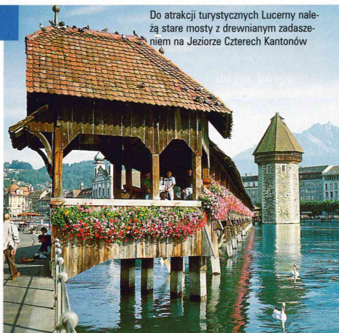
Do atrakcji turystycznych Lucerny należą stare mosty z drewnianym zadaszaniem na Jeziorze Czterech Kantonów

Lucernę opuszczamy boczną szosą nr 10, mijamy Langnau, centrum gospodarcze i kulturalne regionu, przez podmiejskie Worb i Gömligen wjeżdżamy do Berna.