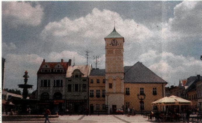
Zabytkowy rynek we Frysztacie