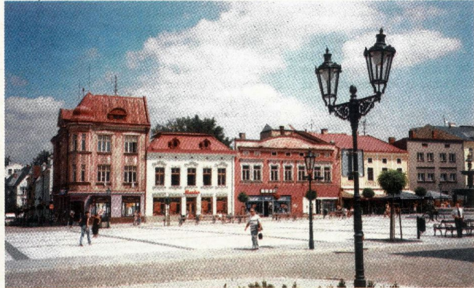
Morawska Ostrawa tworzy historyczne jądro miasta

P rzez aglomerację Ostrawy, rozciągniętą u naszej południowej granicy, jeżdżą tranzytem sporo turystów z Polski. Leżące w Bramie Morawskiej, od pradziejów dogodnym dla komunikacji obniżeniu pomiędzy Karpatai i Sudetami, a dodatkowo u zlewu czterech rzek: Odry i Opawy, Ostrawicy i Łuczyny, miasto jest kluczowym dla tego fragmentu Europy węzłem drogowym i kolejowym. Prowadzą tędy szosy ku Austrii i na Węgry, sama zaś Ostrawa jest ważną stacją na trasie międzynarodowych ekspresów łączących Warszawę z Wiedniem, Pragę, Bratysławą i Budapesztem. Ostrawa stanowi centrum dyspozycyjne najpotężniejszego w Czechach okręgu przemysłowego, w skład którego wchodzi kilka sąsiadujących ze sobą miast (m.in. Karwina, Orłowa, Bogumin, Hawierzów). Ale to ponad 300-tysięczne, trzecie pod względem wielkości miasto Republiki Czeskiej, stolica złożonego z sześciu powiatów regionu morawsko-śląskiego, jest też ciekawe samo w sobie. Ma jak na ośrodek wybitnie przemysłowy zaskakująco dużo zabytków architektury, na czele z gigantyczną, brunatno-piaskową katedrą Zbawiciela. Nieklamana ozdoba Ostrawy są dziesiątki secesyjnych kamienic, w tym ich kompleks na placu Jiráská, dawnym Kurzym Rynku. Serce miasta to Masarykovo