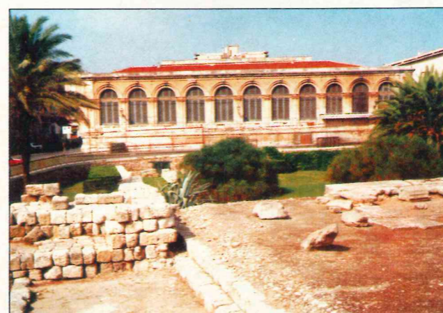
Dobrze zachowane pozostałości antycznej chwały wraz z młodszymi zabytkami i śródziemnomorską przyrodą czynią z Syrakuz miasto o trwałym, romantycznym uroku.

trale”, corso Umberto 141 – jedynka 25 tys. ITL, dwójka 40 tys. ITL, „Milano”, corso Umberto 10 – efektywne, stosunkowo niedrogi i w miarę no-