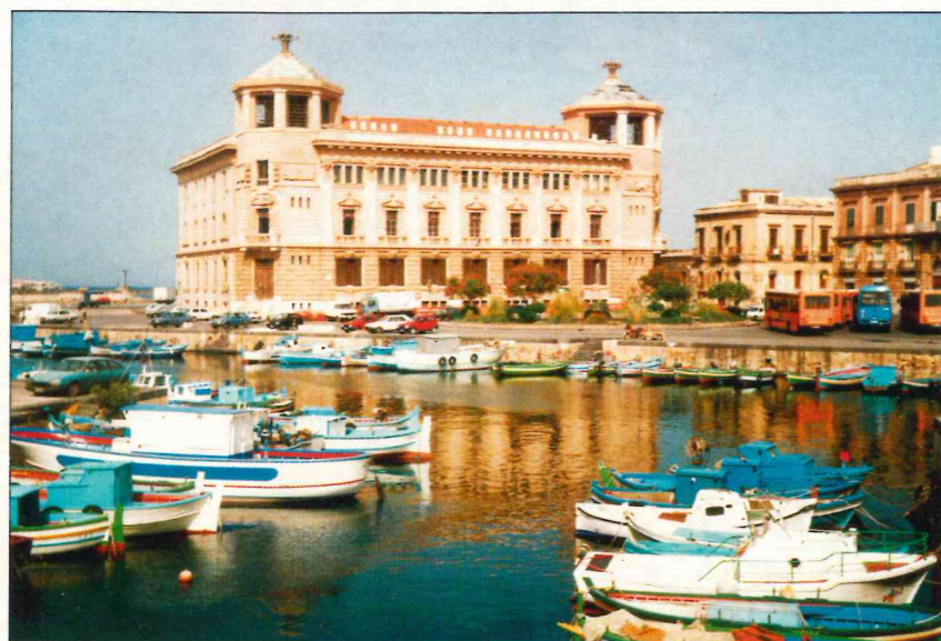
Fragment „porto piccolo” i Ortygii

całego świata. Wracając na stały ląd warto przespacerować się wśród gęszczonej ciasnych uliczek, nie zmienionych w swym zasadniczym układzie od średniowiecza. Sycylijczycy twierdzą, że całe miasto położone jest nad ogromnym labiryntem, wykopany jako schronienie przed najeźdźcami.