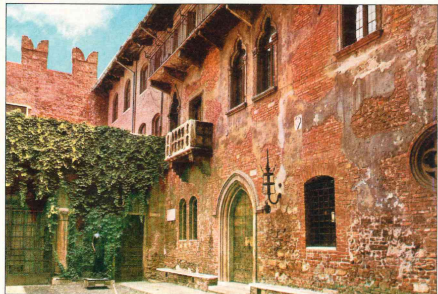
Dom Julii w Weronie